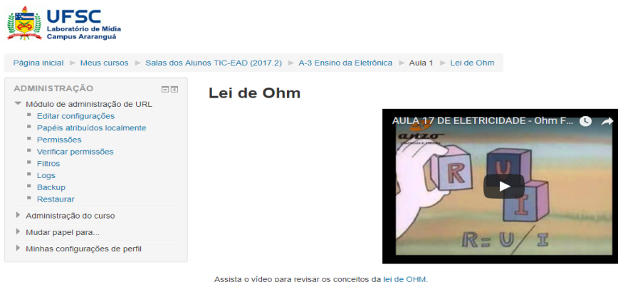
Figura 3: Vídeo inserido no ambiente do curso.