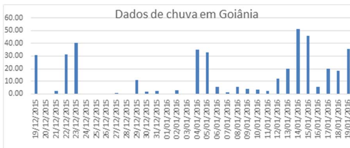
Figura 2 - Dados de chuva da estação Goiânia - GO (OMM: 83423)

Após uma chuva de 35,7 mm no dia 19 de janeiro de 2016, conforme dados da estação (OMM: 83423 – Goiânia-GO) do Instituto Nacional de Meteorologia (INMET), a área em estudo sofreu um alagamento. Há de se ponderar também que a chuva acumulada nos 30 dias que antecederam ao evento de cheia, incluindo a chuva do dia 19 de janeiro de 2016, foi de 424,1 mm, (INMET, 2016), conforme mostra a Figura 2.