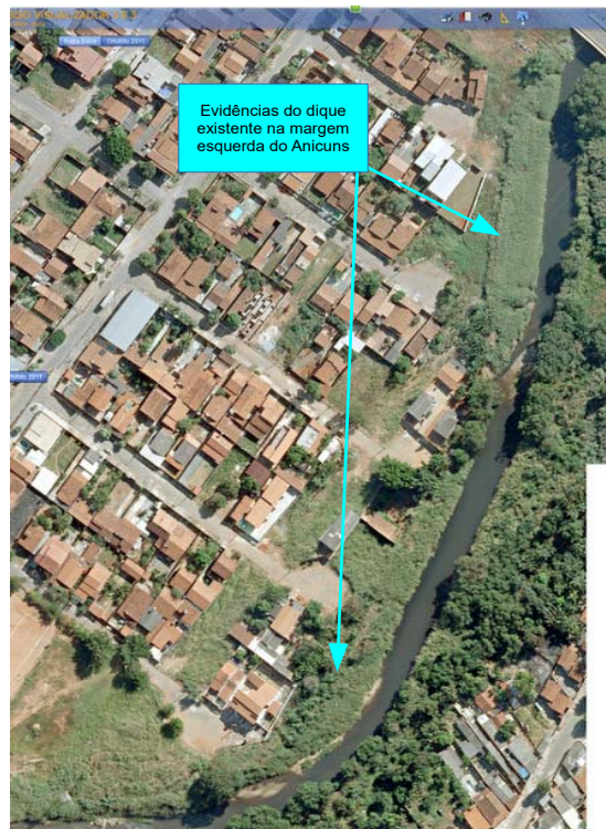
Figura 3 - Evidências do dique existente na margem do ribeirão Anicuns

aproximada de um metro, e no final (parte mais baixa) de cada rua existem bocas coletoras (bocas de lobo) destinadas a captar a água drenada nas sarjetas. As tubulações de drenagem que transpõem sob o dique desembocam no leito do Anicuns a aproximadamente um metro acima de seu nível normal. Das cinco tubulações, quatro contam com válvulas de bloqueio, destinadas a evitar a passagem de água do corpo hídrico para o sistema de drenagem das vias, durante períodos de cheias.