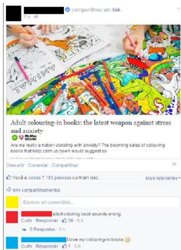
Figura 12: Internautas discutem os livros de colorir para adultos no post sobre o artigo do The Guardian: “livros de colorir para adultos soa errado” diz um, logo seguido por uma segunda pessoa que diz “eu amo meus livros de colorir”