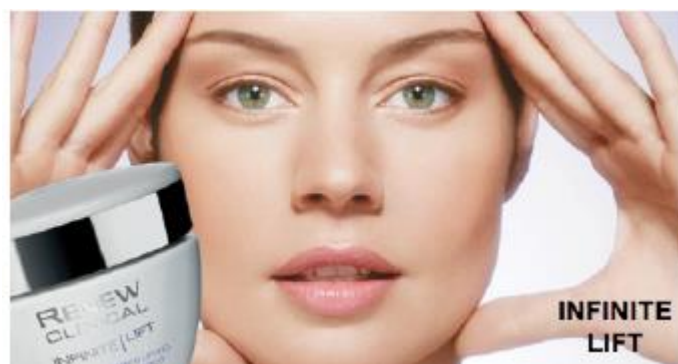
Figura 19: Anúncio de creme anti-idade figurando uma modelo jovem, possivelmente mais nova que o público-alvo do produto

No entanto, é necessário fazer uma ressalva. A juventude está associada a conceitos diversos como novas linguagens e comportamentos, tecnologia, saúde, beleza e potência. Atualmente, a faixa etária de 18 a 24 anos é a mais influente comercialmente, sugestionando tanto consumidores mais novos quanto mais velhos 9 .