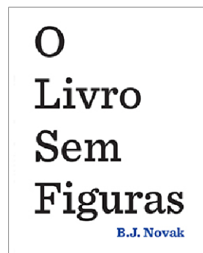
Figura 11: Capa do O livro sem figuras.

O livro infantil em questão é O livro sem figuras (ver figura 11), que como diz o título não tem absolutamente nenhuma ilustração, o que é extremamente incomum para um livro atual dirigido a crianças. Com muito foco na expressão tipográfica e principalmente no humor, este livro foi feito para a leitura em voz alta, por um adulto, para uma criança. O texto sugere que a pessoa que está lendo-o (presumivelmente o adulto que lê para a criança) é “obrigada” a ler tudo aquilo que está escrito no livro em voz alta e foi um grande sucesso de vendas, permanecendo por muitas semanas nos primeiros lugares da lista de mais vendidos do New York Times.